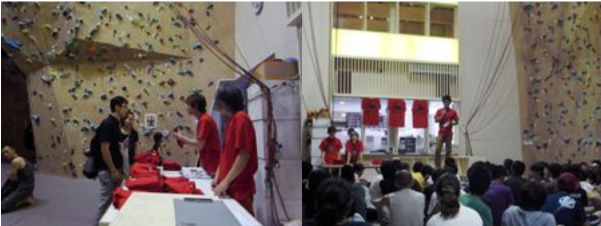
参加賞にはTシャツが！！

毎年恒例となっているパンプシリーズ戦のボルダリングコンペが7月31日に行われた。灼熱の太陽の中、今年は125名の参加者にお越しいただきました！感謝ですっ！！今年はエキスパートクラスを設け、全国から17名の強者達がPUMP2に集結しました。そんな中でも今回、ゲストクライマーとして安間佐千、伊藤秀和をお呼びし、大会を盛り上げて頂きました。