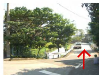
川の右側の道、こちらです！