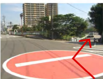
30mほどですぐに「芝川」の橋です。橋は渡らずに右に入ります。ここで間違いやすいので注意！