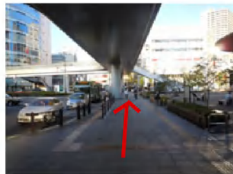
右手にキューポラ・マルエツを見ながら真っ直ぐ進みます。