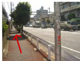
NTTを左手に122号を赤羽方面に歩きます。