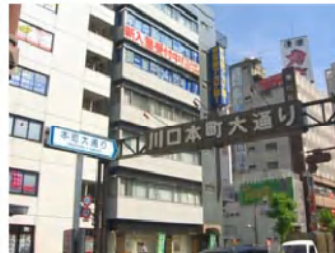
キャストイを左に見ながら、「川口本町大通り」に入ります。