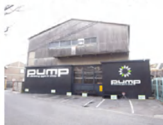
川を左に見ながら2-3分進むと右手にpump1です。