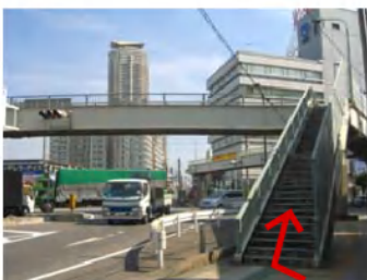
「本町ロータリー」の陸橋で、NTT側に渡ります。