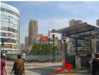
川口駅、東口を出たら右のエスカレーターで下ってください。