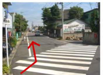
極真カラテの看板を右手に見ながら道なりに進みます。