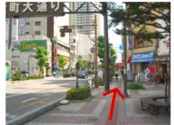
本町大通りを700m、国道122号線まで7-8分直進。「本町ロータリー」の交差点まで進みます。