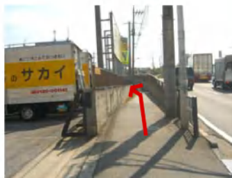
ジェームス、引越しのサカイを通り越します。歩道は122号とそれて左に入るので、そのまま進みます。